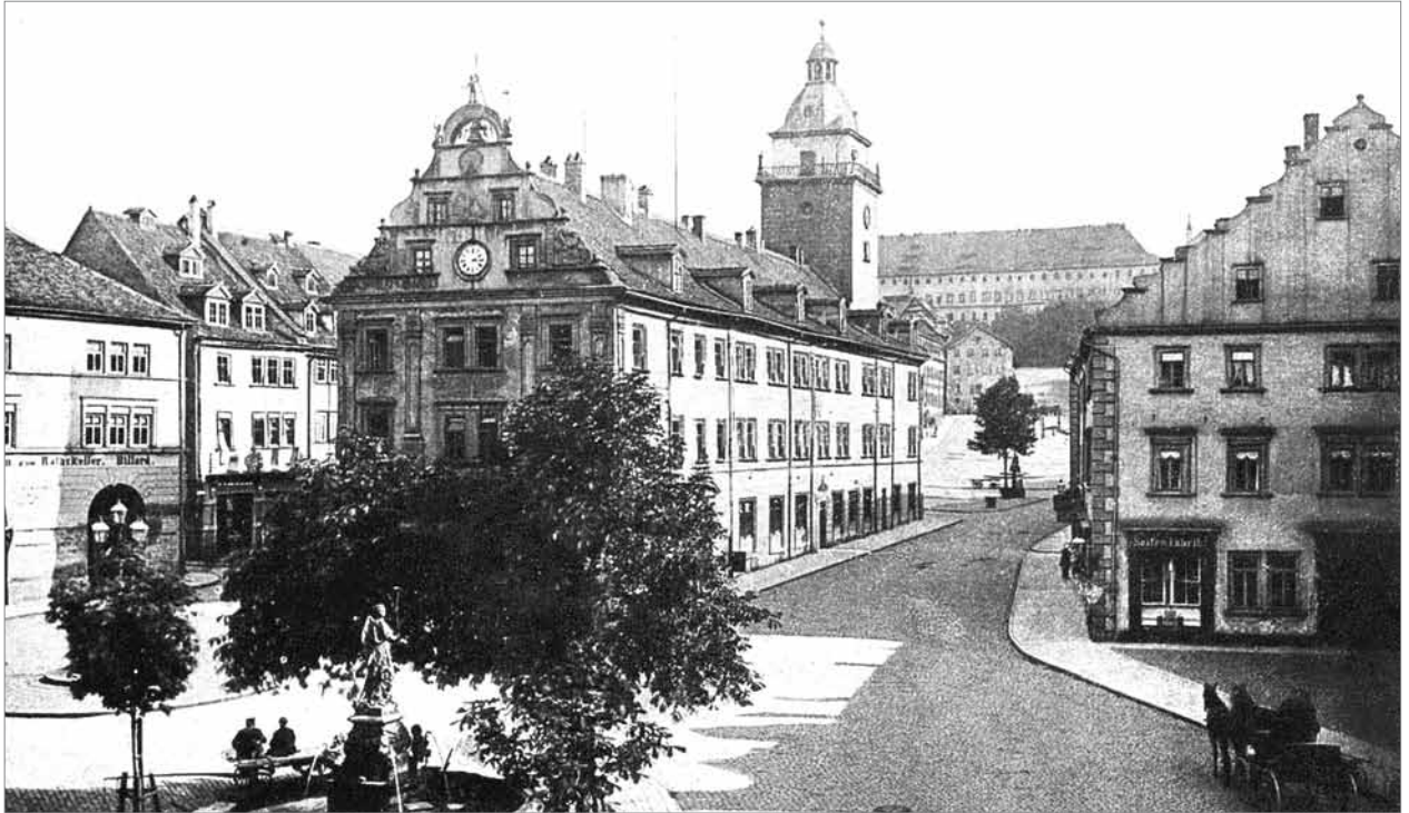
Rathaus Gotha vor 1895

dessen goldenem Boden nicht geerntet hatte“. 8 Döll selbst schreibt über diese Jahre: „ich hatte das Gefühl, mit meiner Arbeit Wasser im Siebe zu schöpfen“. 9